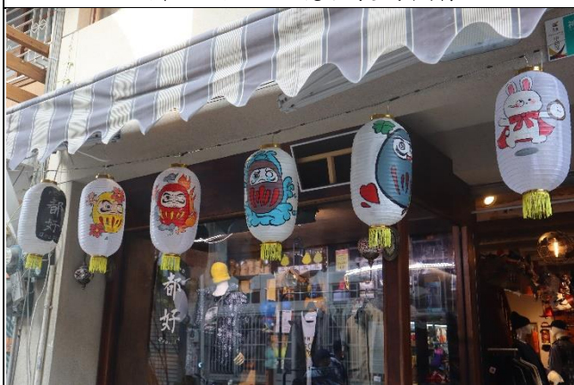
照片說明:86 號燈展的模樣