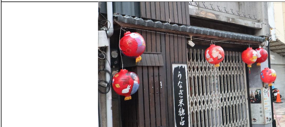
照片說明:105 號燈展的模樣