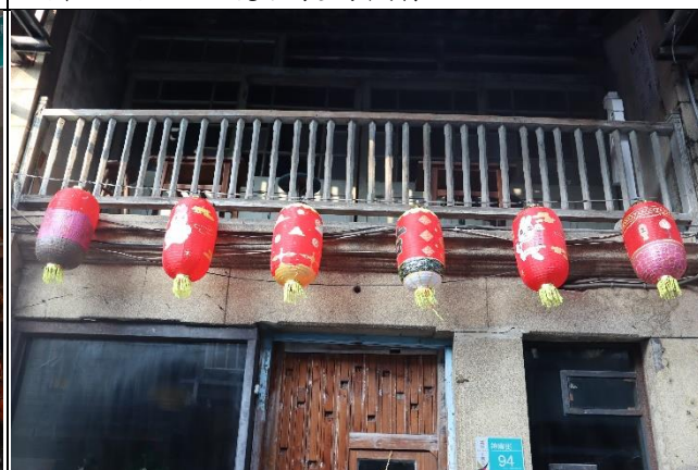
照片說明：94 號燈展的模樣