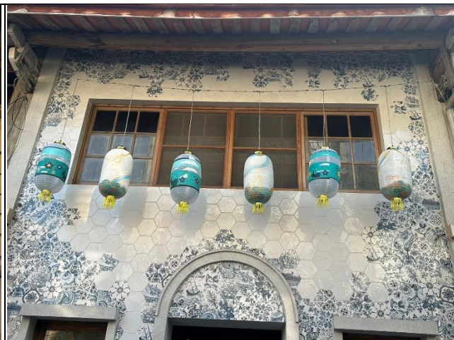
照片說明：77 號燈展的模樣