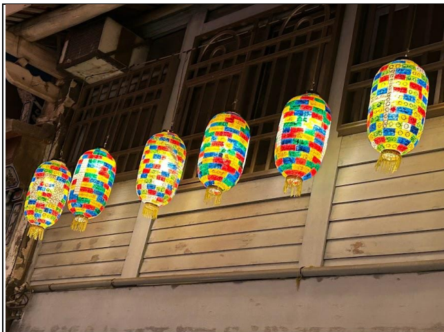
照片說明：73 號燈展的模樣