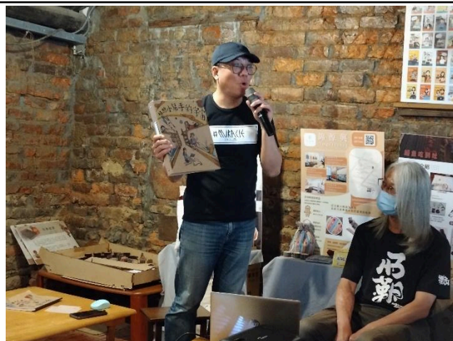
照片說明：管家日誌