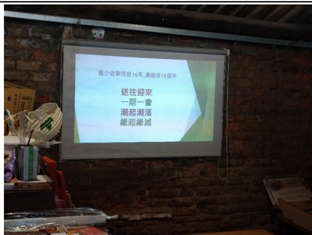
照片說明：從結論開始 2