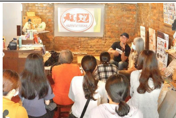
照片說明：從結論開始 1