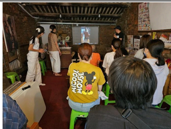
照片說明：分享房客的表演

註：舉凡工作坊、研討會、讀書會、專題演講等活動，皆請於活動後2週內填報本表。並繳交下