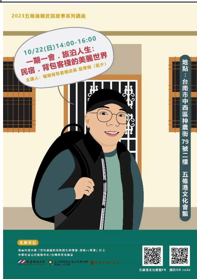
照片說明：課程海報