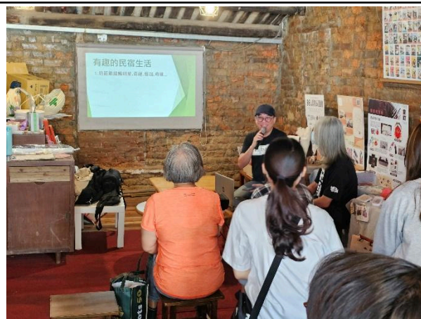
照片說明：從結論開始 3