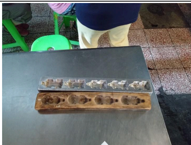
照片說明：九豬十六羊的模型