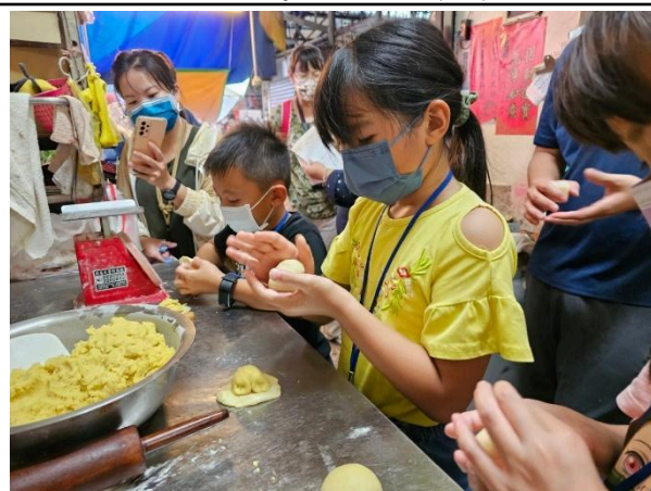
照片說明：小朋友也來體驗