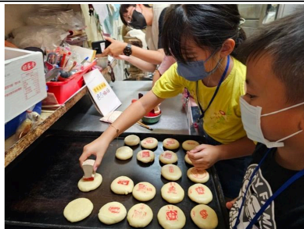
照片說明：蓋上寶來香的專屬活動章