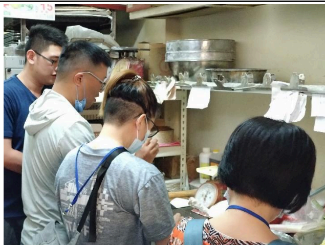
照片說明：手作綠豆椪