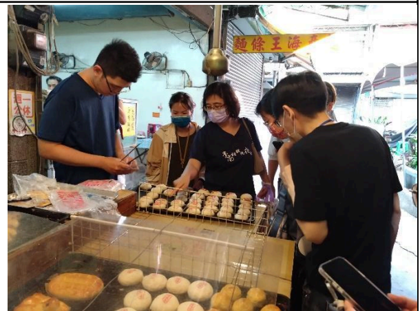
照片說明: (上)蓋上寶來香吉祥物章 (下)認領作品

註:舉凡工作坊、研討會、讀書會、專題演講等活動,皆請於活動後2週內填報本表。並繳交下列佐證資料:如活動海報、簽到表、活動照片(至少6張)、活動手冊、演講完整講稿或PPT等。繳交之檔案以原始檔為主(如word、excel等)。