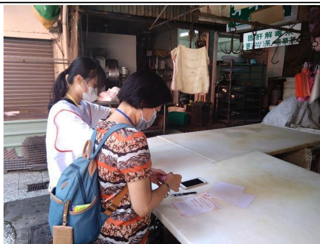
照片說明：認識水仙宮