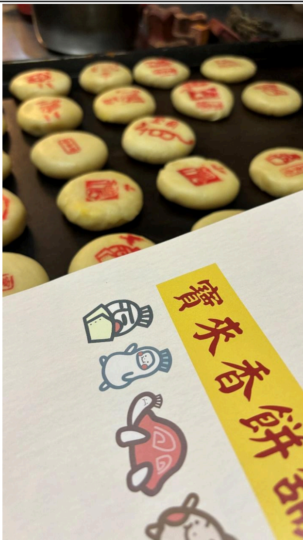
照片說明:蓋著各式寶來香圖案的成品