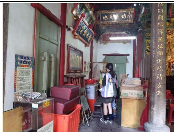
照片說明：水仙宮尋寶