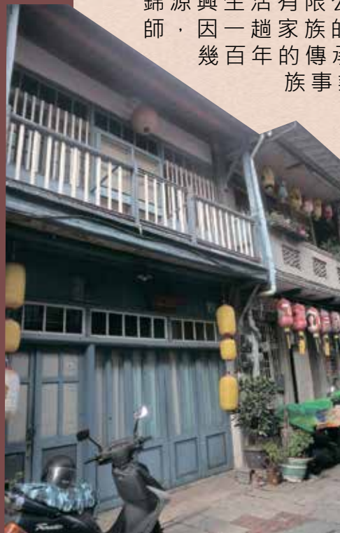
目前神農街68與70號的模樣

作的他，雖然業務蒸蒸日上，但對他而言總覺得缺少了什麼，曾有過的家族事業應是那塊缺少的線，因自己是外孫女的兒子，在徵得家族長輩的同意，踏上尋找家族事業之路，訪談長輩，到處找文獻資料，用盡各種方式，終於如願的在2020年的二月辦了「錦源興百年故事展」。