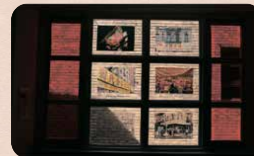
三樓定期舉辦設計相關的藝文展覽