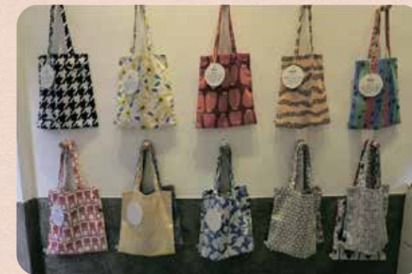
講在地生活文化故事的印花布所製成的手提袋產品