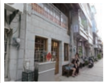
▲ 座落於神農街的五條港行號

此外設計理念都以在地的故事或文化作背景，譬如五條港早年以船運送貨物，因此行號以當時的台灣船的船身顏色，匯集在背包上，跟台灣船比照起來真的相當的像，也很有歷史背景。傳承以前的精神由「布」為出發點，將五條港的特色與故事，做成日常生活的用品，讓大家在日常生活中也可以了解以前的故事。因此每樣商品上都有專屬的歷史或故事，這也是文化協會一直在努力執行的文創特色產業。