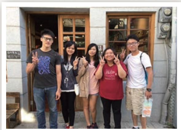
◀ 鄭老師與採訪同學的合照