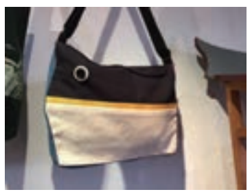
▲ 以船為故事背景的布包