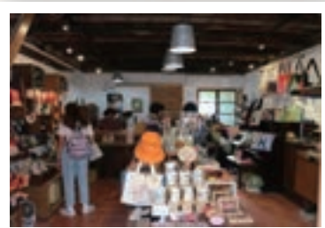
▲ 五條港行號內部陳設文創商品的模樣